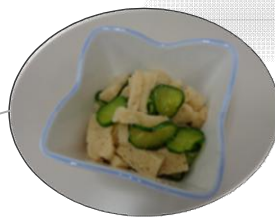
【茨城県】すだれ麩のごま酢和え