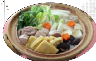
【東京都】ちゃんこ鍋