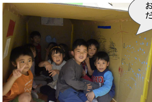
戸を閉めると実 は真っ暗！