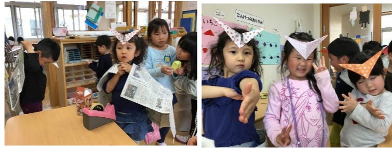
自分で変身グッズを工作して、正義の味方★なりきりレンジャー参上!